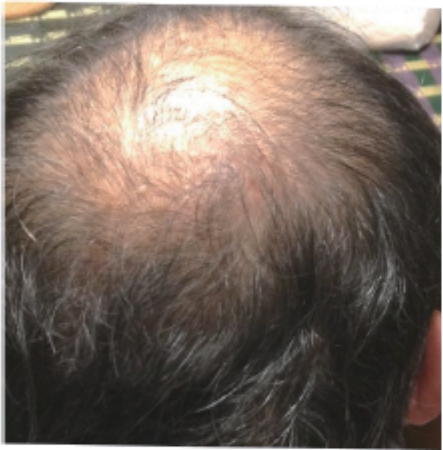
頭皮の状態 頭皮が赤くなった状態だった