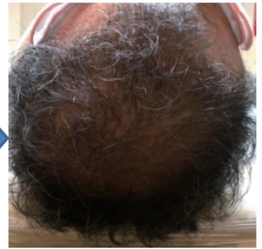
毛も太くなってきた