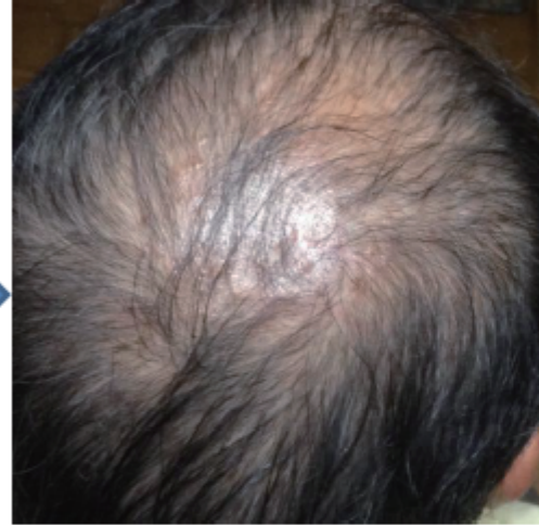
しっかりした毛になり細かい毛も増えてきた